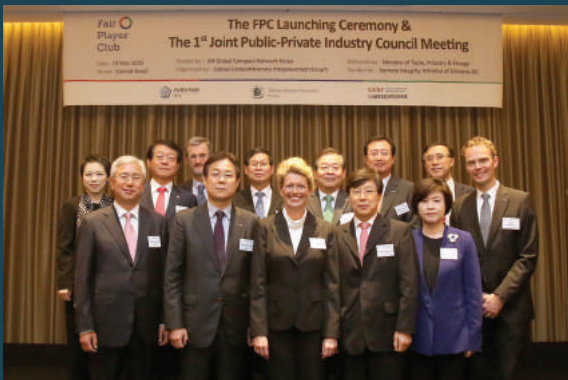
페어플레이어클럽 출범식 (2015년 5월 19일)