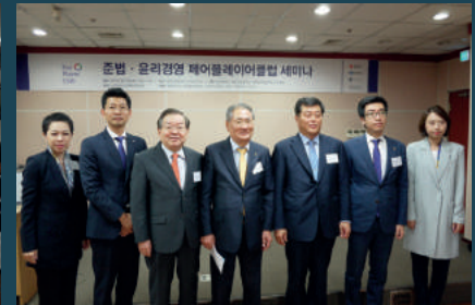
광주시 준법·윤리경영 페어플레이어클럽 세미나 (2016년 9월 22일, 광주)