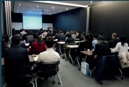
해외건설산업 준법·윤리경영 페어플레이어클럽 세미나 (2015년 12월 11일, 서울)