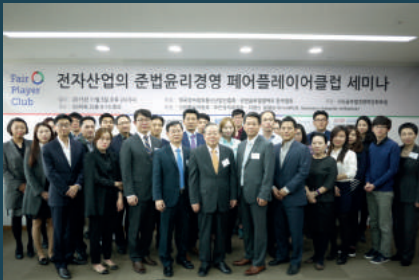
전자산업 준법·윤리경영 페어플레이어클럽 세미나 (2015년 11월 5일, 서울)

해외건설협회 | 한국기계산업진흥회 | 한국자동차산업협회 | 한국전자정보통신산업진흥회 한국의료기기산업협회 | 한국철도협회 | 한국사내변호사회