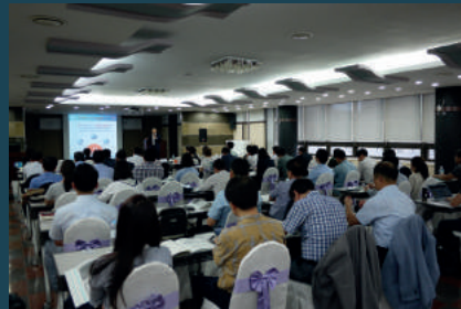
부산시 준법·윤리경영 페어플레이어클럽 세미나 (2016년 9월 20일, 부산)