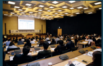
한국사내변호사회 준법·윤리경영 페어플레이어클럽 세미나 (2016년 10월 11일, 서울)