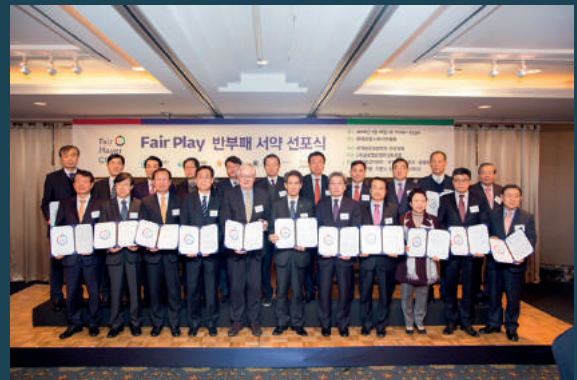
제1회 페어플레이어클럽 서약 선포식 (2016년 2월 18일)