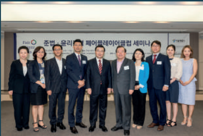
서울시 준법·윤리경영 페어플레이어클럽 세미나 (2016년 7월 14일, 서울)

서울특별시 | 부산광역시·부산상공회의소 | 광주광역시·광주상공회의소 | 대구광역시·대구상공회의소 대전광역시·대전상공회의소 | 인천광역시·인천상공회의소 | 울산광역시·울산상공회의소